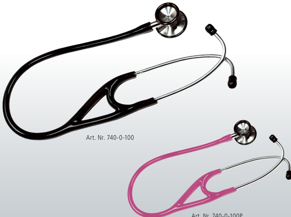
Art. Nr. 740-0-100

... for a perfect auscultation in cardiology as well as pneumology. The very smooth fit of the ear tips together with the individually adjustable headset ensures perfect comfort – disturbing ambient noises are reduced.