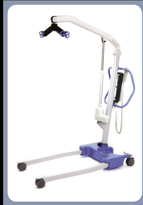
Presence 227 Gurtlifter